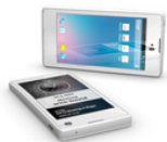
Yota Phone, il primo smartphone russo