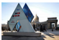
Sochi 2014, 1,500 miliardi di rubli per lo sport