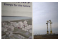
La Bulgaria e il nucleare russo