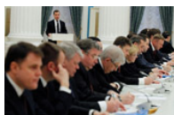
L'agenda economica della Russia