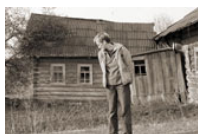
Il fiume della vita