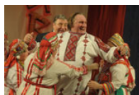
La Russia paradiso fiscale per ricchi europei?

Il grande cinema russo a Verona 21 gennaio - 25 marzo