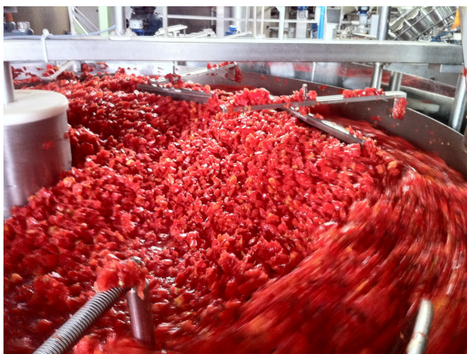
La produzione della passata di pomodoro nell'azienda Coppola

L'azienda salernitana è stata selezionata a partecipare al programma di azioni promozionali del Ministero dello Sviluppo Economico (MiSE) e da Federalimentare per sostenere il vero cibo italiano e contrastare il fenomeno dell'Italian Sounding, che si terranno a Mosca durante la fiera internazionale Prodexpo, dall'11 al 15 febbraio 2013 . "Come aderenti a Federalimentare e Anicav, l'associazione nazionale dei conservieri, ci siamo candidati al bando di Federalimentare per questa iniziativa. È importante per noi portare all'estero il vero cibo italiano perché ci assicura ritorni in termini di fatturato e di benchmark qualitativo. Seguiamo e partecipiamo attivamente agli eventi che il nostro Paese organizza attraverso l'Ice e altre organizzazioni per la promozione del sistema Italia all'estero, inoltre la nostra linea di prodotti è complementare ai prodotti delle altre società parte della delegazione selezionata dal MiSE".